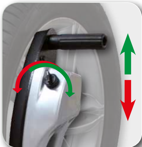
AUTOMATICO - AUTOMATIC